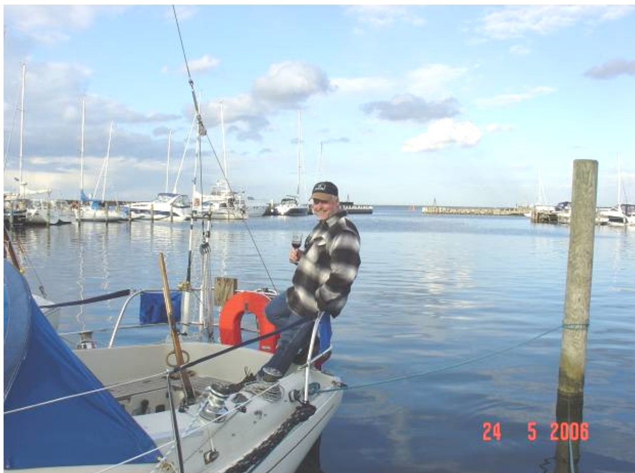
Sterna fortøjet på midtermolen i Dragør Havn