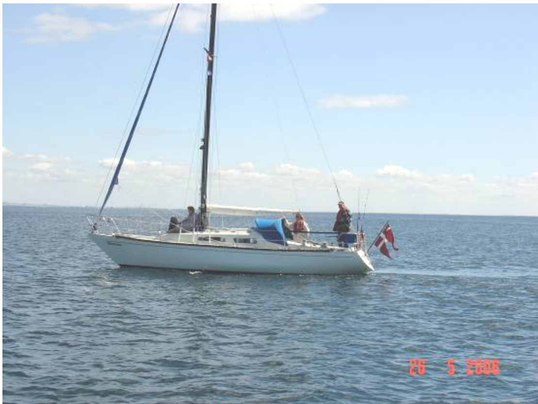
Sterna i Øresund