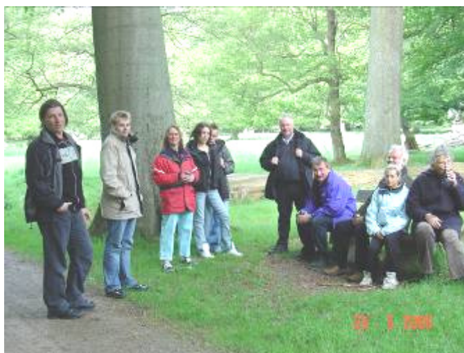
Stampladsen i Dyrehaven, hvor vi holdt drikkepause